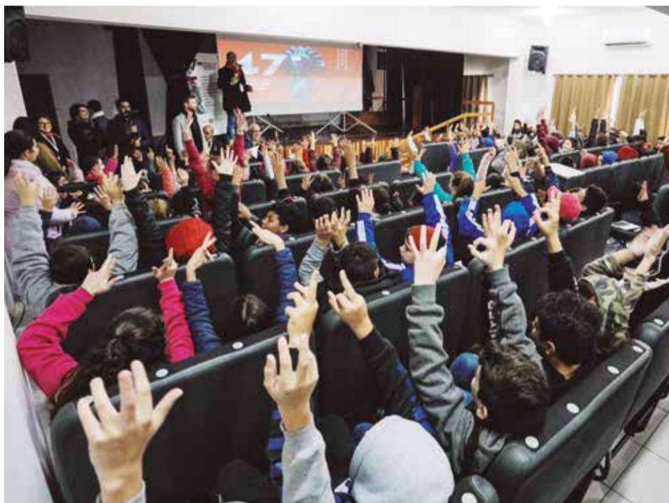
“A iniciativa se insere na proposta de descentralização das atividades do Festival de Gramado.”

Os títulos selecionados foram o infantil “Detetives do prédio azul 2”, com a trupe infanto-juvenil desafiada a atravessar um oceano para concluir uma investigação e salvar um grupo de crianças enganadas por dois bruxos disfarçados de produtores de um concurso musical. O filme é dirigido por Viviane Jundi e no elenco