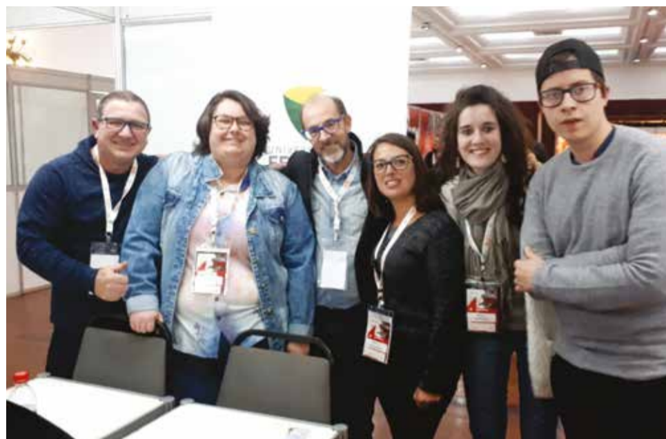
“O Curador ao centro com seus alunos da Feevale”